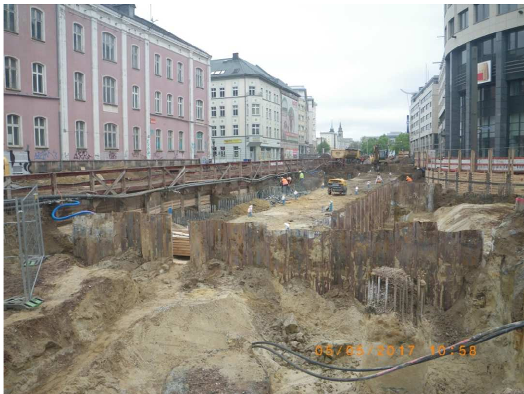
Aushub und Pfahlkopfstemmen, A 10 Tunneldecke