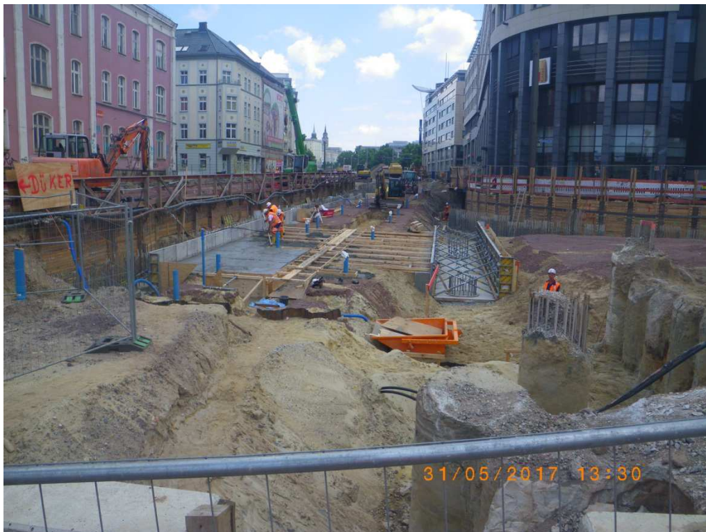
Tunneldecke, Beginn Sauberkeitsschicht